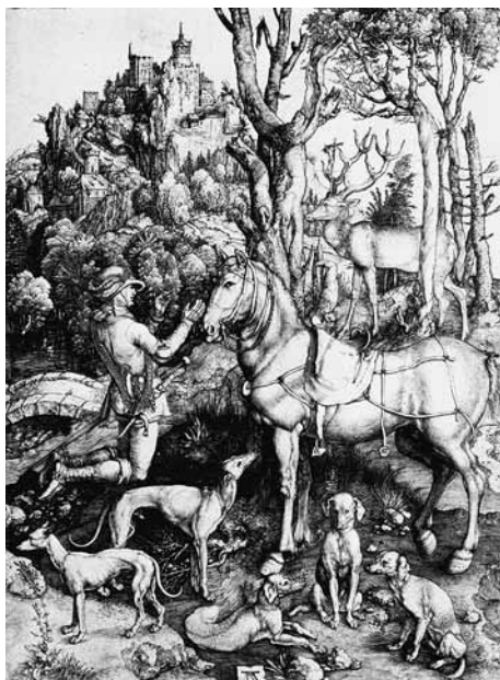
Fig. 3: Albrecht Dürer, Sant'Eustachio (1501).