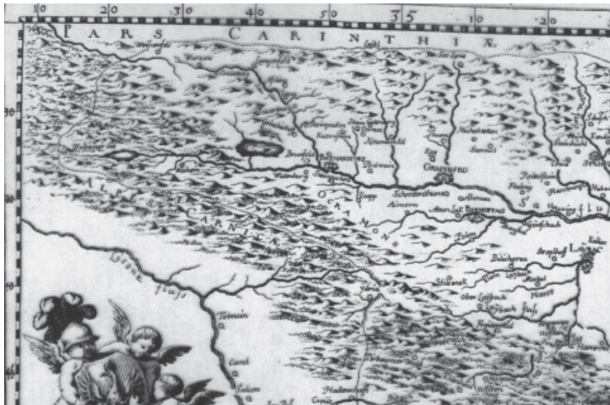
Ausschnitt aus J. W. Valvasor, Die Ehre des Herzogtums Crain. Topographisch-historische Beschreibung, Zweites Buch, 100/101 .