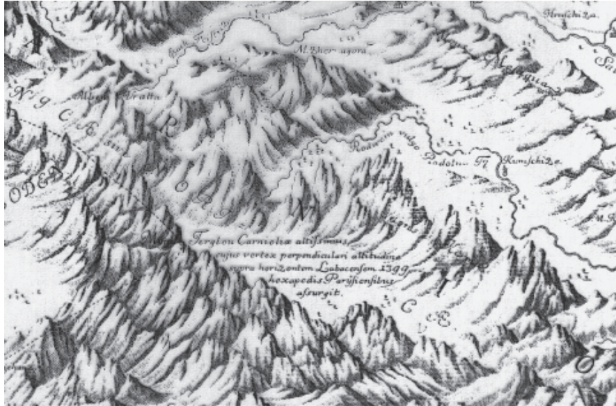
Ausschnitt aus J. D. Florianschitsch de Grienfeld, Ducatus Carnioliae .