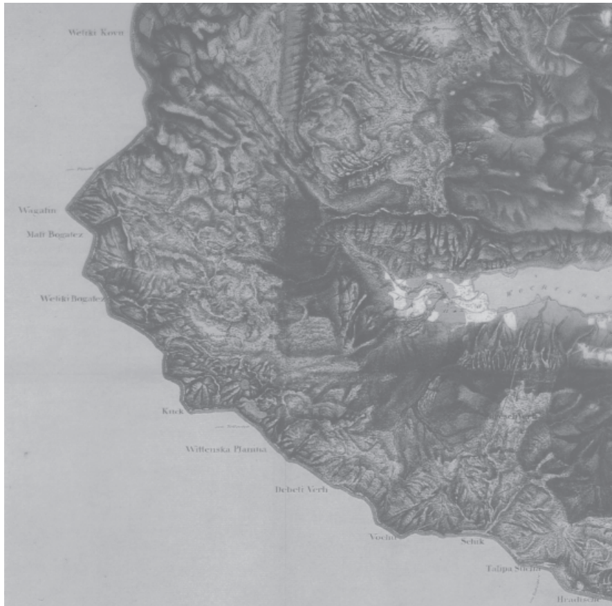
Ausschnitt aus der Franziszeischen Landesaufnahme, Zone 7, westl. Colonne IV (Kriegsarchiv Wien, Kartensammlung B IX a 59-2).