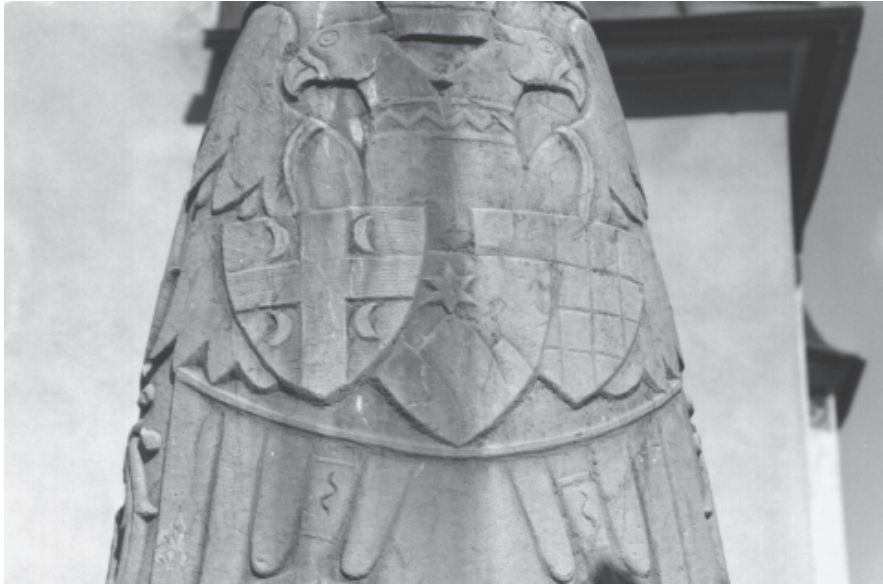
Triglav als slowenisches Symbol auf dem Mantel der Muttergottes vor der Pfarrkirche in Bled, ausgearbeitet vom Architekten Jože Plečnik, 1934.